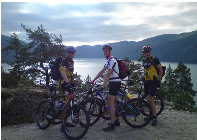
Fabelaktig utsikt omtrent halvveis mellom Ulefoss og Vrådal, etter litt aktiv sykling i bakker.