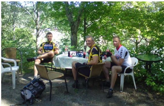
Lunsjen inntas i omgivelser som gir flashback for de som har sett filmen "Piknik med døden" ☺