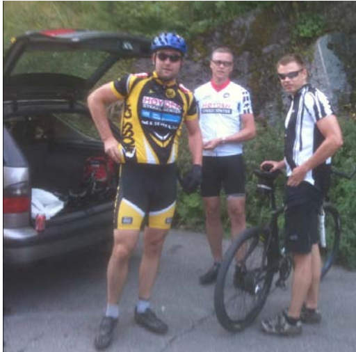
Oppstart i Ulefoss, sjekk antrekk.